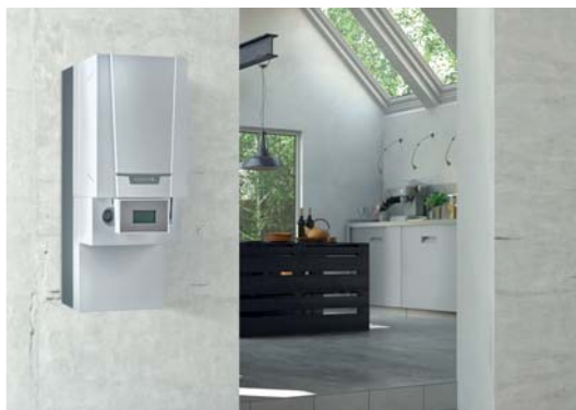
Hybridní vnitřní modul s plynovým kotlem