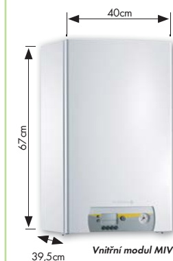
Vnitřní modul MIV