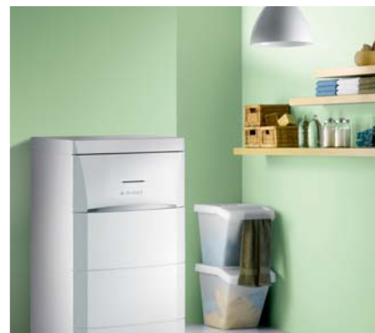
Stacionární vnitřní modul se zásobníkem TV