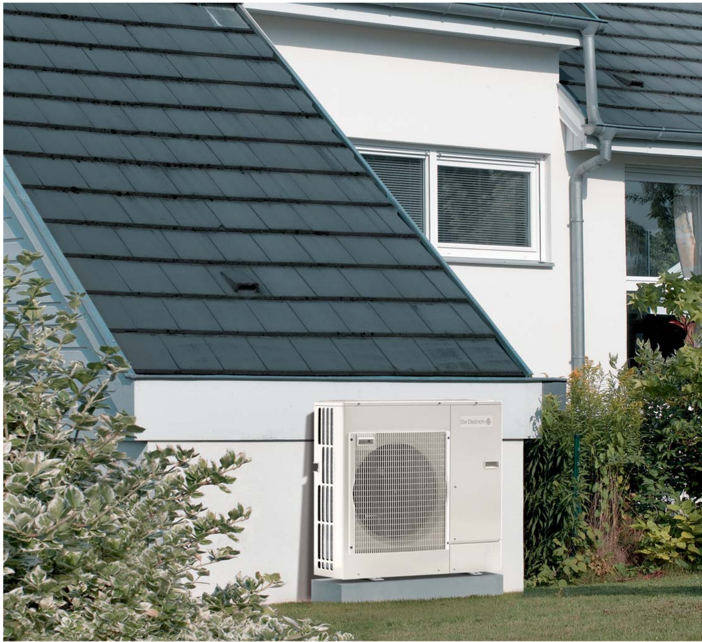
Venkovní jednotka Alezio