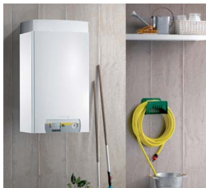
Závěsný vnitřní modul